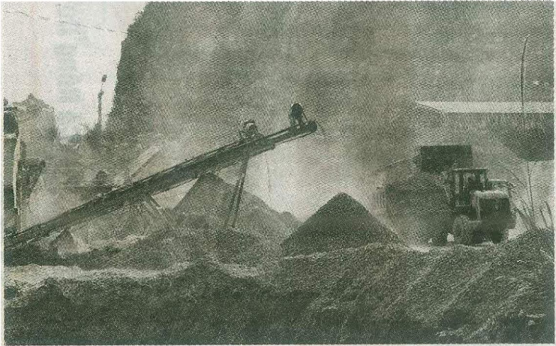
Sản xuất đá ở Quý Lộc.

chất và Khoáng sản năm 2024 rút ngắn được một số thủ tục và hồ sơ về quy trình như không cần căn cứ vào quy hoạch, không cần căn cứ vào đánh giá trữ lượng cũng như các hồ sơ đánh giá về tác động môi trường.